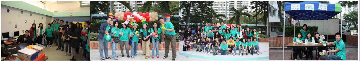
2011年11月12日 - 基督教家庭服務中心 愛環境嘉年華